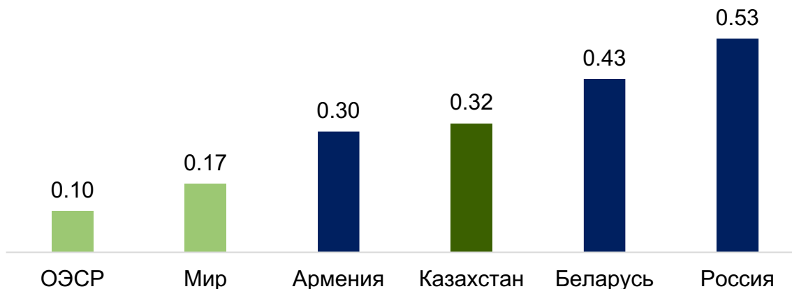
YeOIH va IHTT mamlakatlari bilan taqqoslash*

*Xalqaro energetika agentligining 2020-yil uchun ma'lumotlari